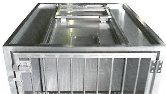
狭体ハンドル 《ローラー式》